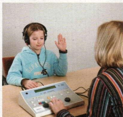
Una bambina durante una seduta

chi di frequenze acute, e i canti gregoriani, che contengono tutte le frequenze della voce umana e presentano un ritmo simile al respiro.